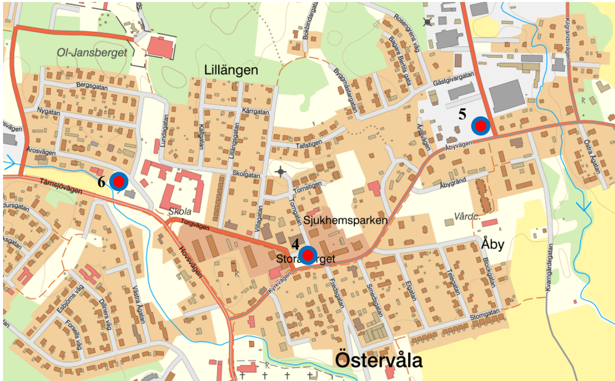
Figur 2. Kartbild över Östervåla med Uppställningsplats 4, 5 respektive 6 markerad.

Vattentankar för allmänheten att hämta vatten i ska placeras på Uppställningsplatser 4, 5 och 6, vilka är markerade på kartan i Figur 2.