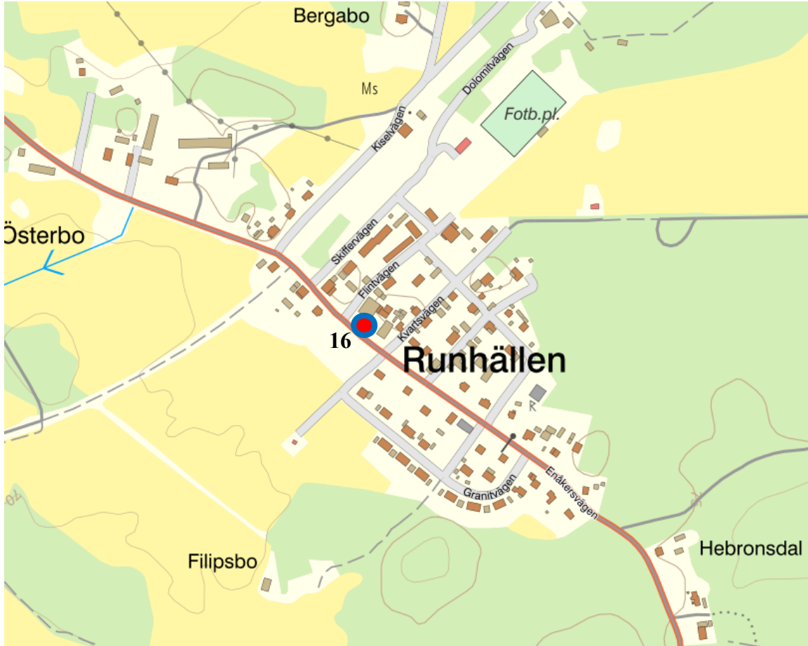
Figur 8. Kartbild över Runhällen med Uppställningsplats 16 markerad.

Heby kommun Dnr: KS/2024:42:3 HandlingsId: 2024:842 Datum: 2024-04-19