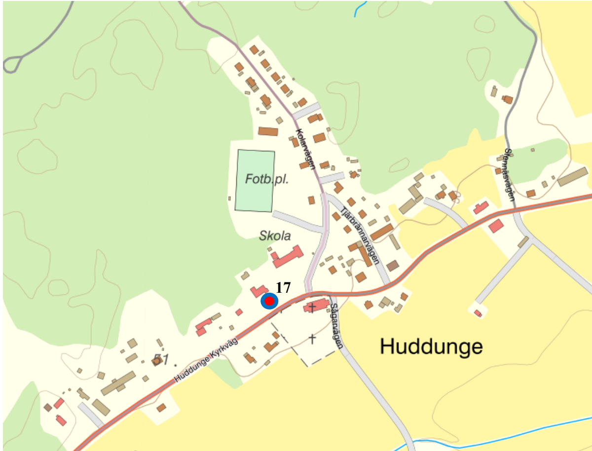
Figur 9. Kartbild över Huddunge med Uppställningsplats 17 markerad.

Heby kommun Dnr: KS/2024:42:3 HandlingsId: 2024:842 Datum: 2024-04-19