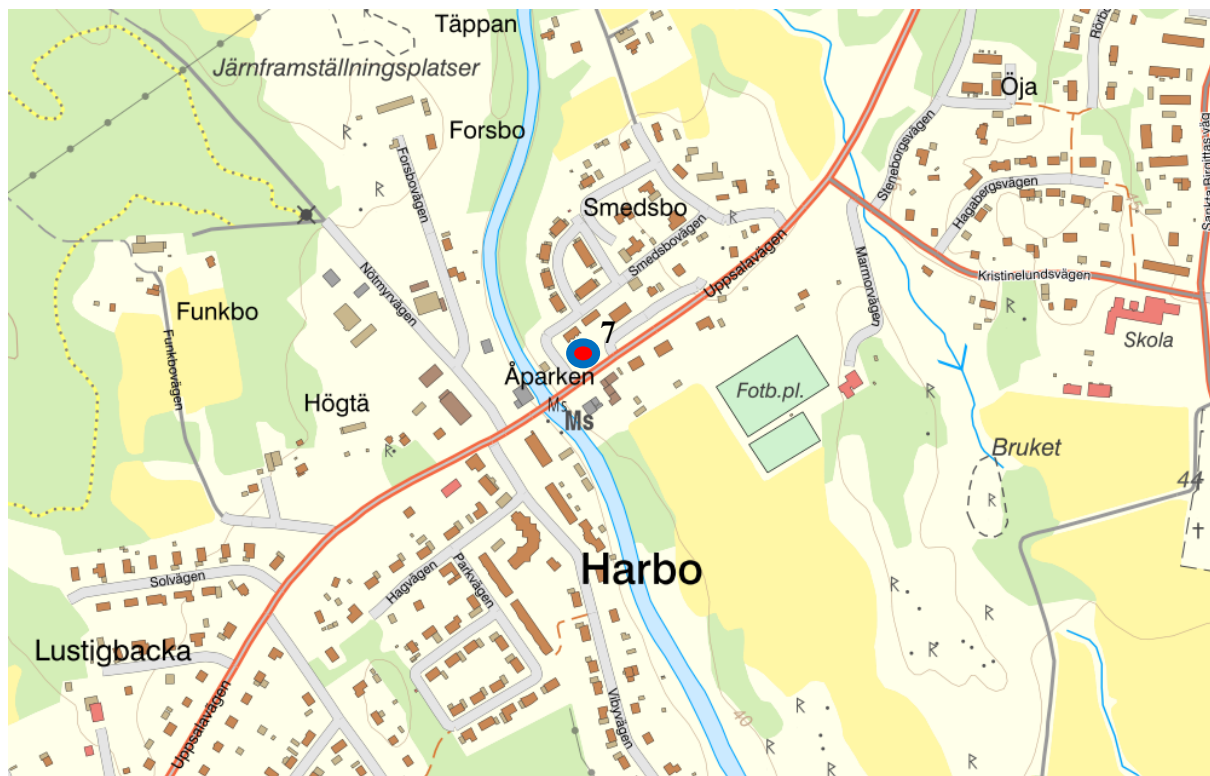
Figur 3. Kartbild över Harbo med Uppställningsplats 7 markerad.

Heby kommun Dnr: KS/2024:42:3 HandlingsId: 2024:842 Datum: 2024-04-19