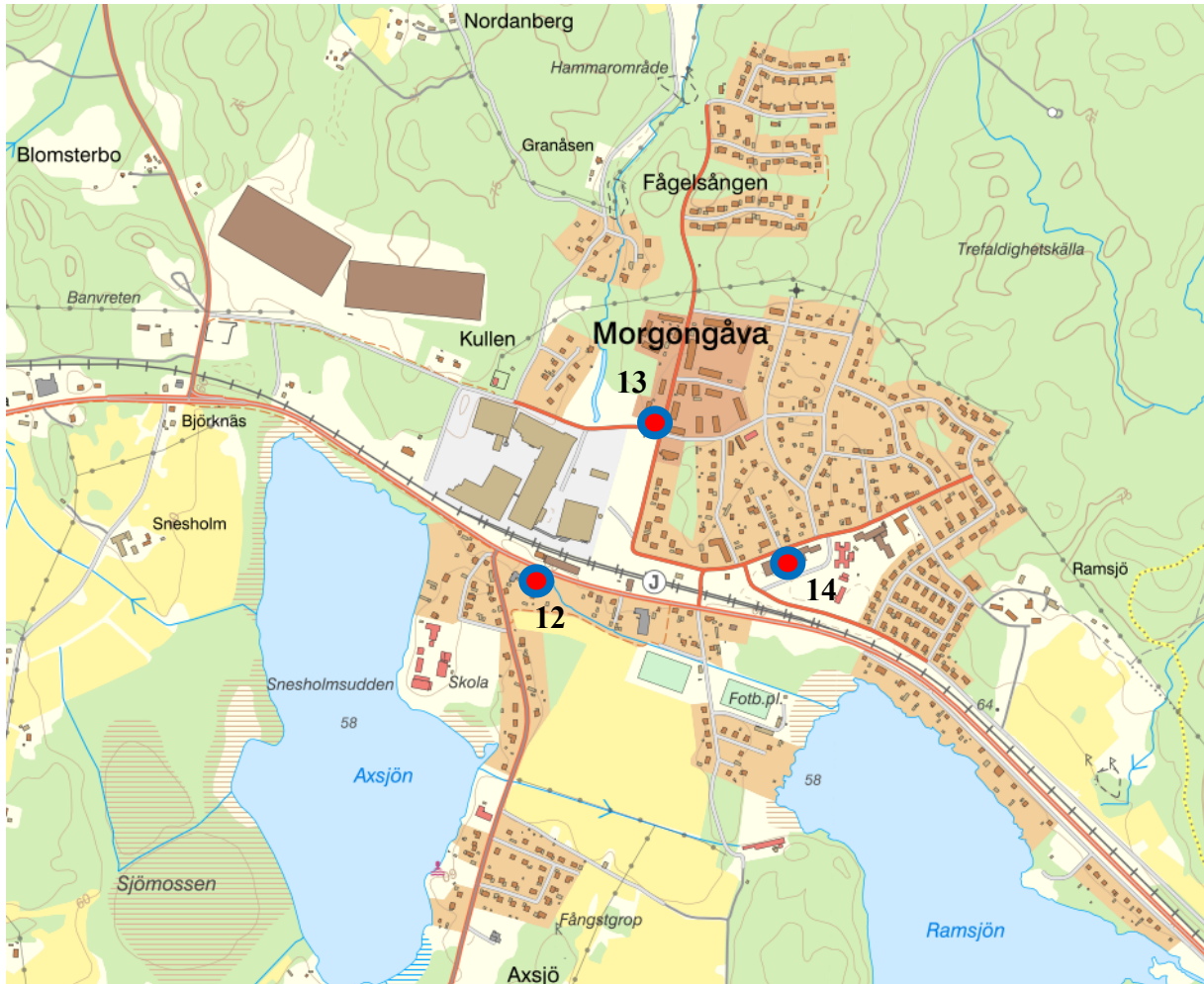
Figur 6. Kartbild över Morgongåva med Uppställningsplats 12, 13 och 14 markerad.

Heby kommun Dnr: KS/2024:42:3 HandlingsId: 2024:842 Datum: 2024-04-19