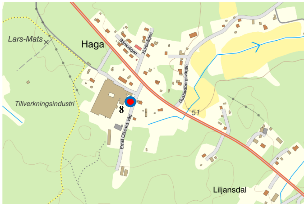
Figur 4. Kartbild över Haga med Uppställningsplats 8 markerad

Heby kommun Dnr: KS/2024:42:3 HandlingsId: 2024:842 Datum: 2024-04-19