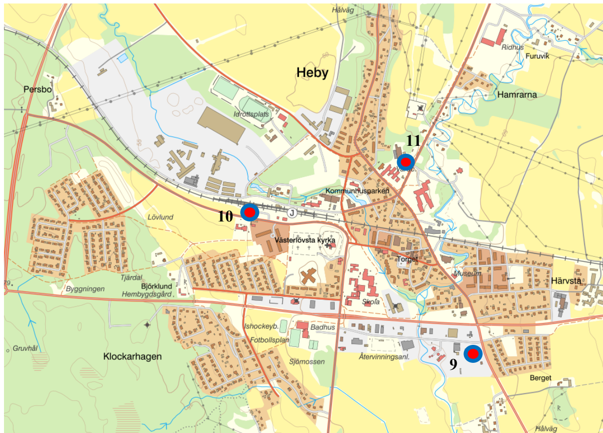
Figur 5. Kartbild över Heby med Uppställningsplats 9, 10 respektive 11 markerad.

Vattentankar för allmänheten att hämta vatten i ska placeras på Uppställningsplatser 9, 10 och 11, vilka är markerade på kartan i Figur 5.