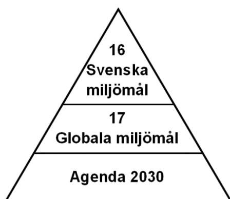
Figur 2. Figuren visar förhållandet mellan Agenda 2030, de Globala miljömålen och Sveriges miljömål.

I Sverige har vi konkretiserat dessa i Sveriges 16 miljömål.