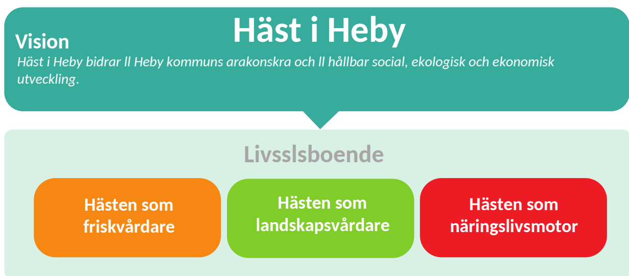
Bild av Häst i Hebys vision och strategi.

Övergripande idé: Hästen gynnar alla som bor, verkar och/eller gör besök i Heby kommun.