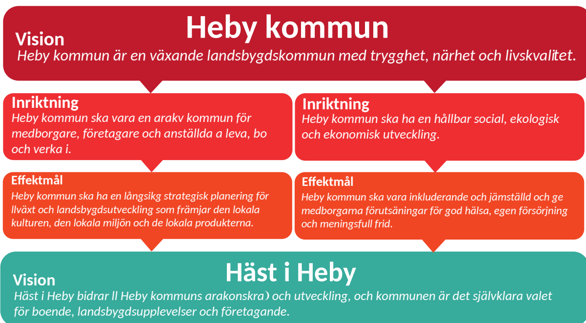
Bild av relationen mellan Heby kommuns övergripande vision, inriktningar och effektmål, och varumärket Häst i Heby.

Häst i Heby som varumärke har funnits sedan 2001. Varumärket syftar till att främja och bidra till Heby kommuns övergripande vision om att vara en "växande landsbygdskommun med trygghet, närhet och livskvalitet". Mer specifikt ska varumärket bidra till två av Heby kommuns inriktningar om att "vara en attraktiv kommun för medborgare, företagare och anställda att leva, bo och verka i" liksom att Heby kommun ska ha en "hållbar social, ekologisk och ekonomisk utveckling". Inriktningarna har i sig varsitt effektmål som arbetet med varumärket Häst i Heby styrs av, nämligen att Heby kommun "ska ha en långsiktig, strategisk planering för tillväxt och landsbygdsutveckling som främjar den lokala kulturen, den lokala miljön och de lokala produkterna" samt att kommunen ska vara "inkluderande och jämställd och ge medborgarna förutsättningar för god hälsa, egen försörjning och meningsfull fritid".